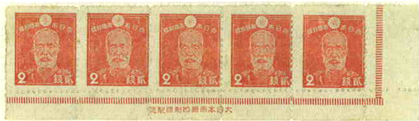
Imprint : Type 6 (short)