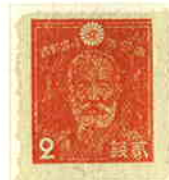
Dull-Vermilion (Mar. '45)