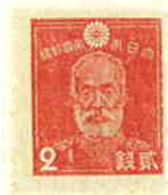
Rose-Red (7 Dec. '44)